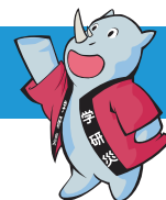
学研災キャラクター サイちゃん

拝啓 時下益々ご清祥のこととお慶び申し上げます。この度、お子様の合格を心よりお祝い申し上げます。